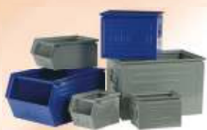
Ukládací bedny Metal storage bins