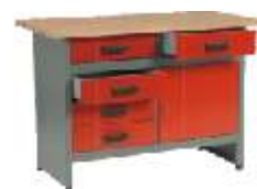
Pracovní stoly, skříně a panely Work benches, cabinets and panels