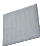
Mřížky a kování Grids and Fittings