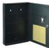
Schránky na úschovu klíčů Key storage box